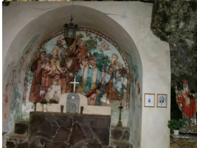
Interno Grotta di San Biagio Cp357