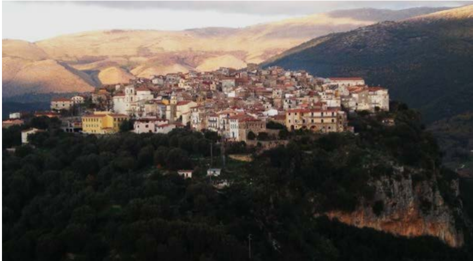
Il paese arroccato di Camerota (SA)